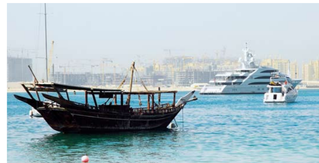
En gammel arabisk båd, dhow, for anker foran byggeriet på den første palme: Palm Jumeirah.