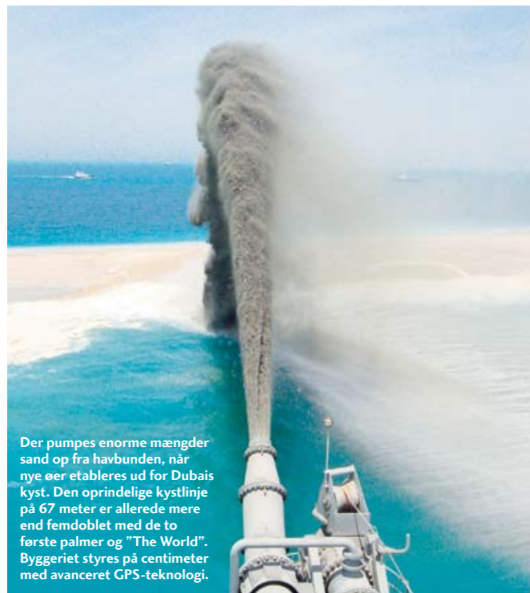
Der pumpes enorme mængder sand op fra havbunden, når nye øer etableres ud for Dubais kyst. Den oprindelige kystlinje på 67 meter er allerede mere end femdoblet med de to første palmer og "The World". Byggeriet styres på centimeter med avanceret GPS-teknologi.

Nakheel, der bygger de mange nye øer, har siden vedtaget en bæredygtig politik, der blandt andet har til formål at genopbygge havmiljøet omkring de nye kunstige rev. Nakheel har for eksempel indfanget fisk, krabber, blæksprutter og andre arter fra tørlægningen og sat dem fri andre steder. Ifølge Nakheel selv er både koraller og omkring 35 forskellige typer fisk og havdyr allerede nu tilbage på det kunstige rev omkring den første palme. At koralrev kun vokser en centimeter om året og derfor kan være hundredvis af år om at opnå fordums storhed, nævner firmaet ikke. Den bæredygtige politik indeholder også bestemmelser om bæredygtig økonomi, og så længe det kan betale sig at etablere nyt land, stopper byggeriet i og mellem koralrevene næppe. ■