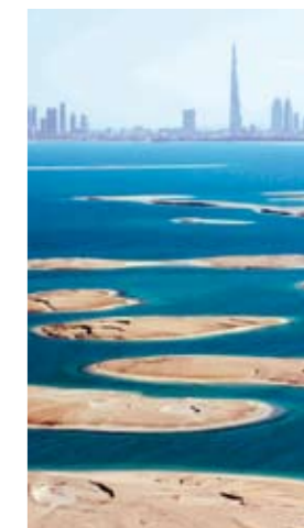
De endnu ubebyggede øer i The World har udsigt til verdens højeste bygning, Burj Dubai.

Hertil kommer projekter som Dubai Waterfront, som er en række større øer, i alt dobbelt så store som Hongkong, med plads til 1,5 mio. indbyggere og 1 mio. arbejdspladser. I øjeblikket er 3.000 kraner og entreprenørmaskiner i gang med projektet.